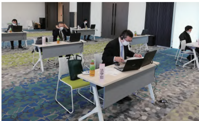
↑オンラインで相談に応じた教職員

オンラインによる個人面談が11月6、7日と13、14日の土日で開催され、91件の利用がありました。1人当たり約20分の相談時間で、内容に応じて担当の教職員が対応しました。相談後のアンケートでは、「就職活動に向けた話を聞き、納得するとともに、子どもに的確なアドバイスができそう」「成績通知表について、授業や試験の状況を確認することができて安心した。ゼミの流れも説明いただき参考になった」など、満足の声が多く寄せられました。