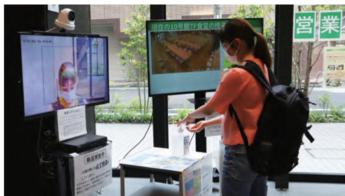
↑ 構内に入るときには検温と手指の消毒を行います。