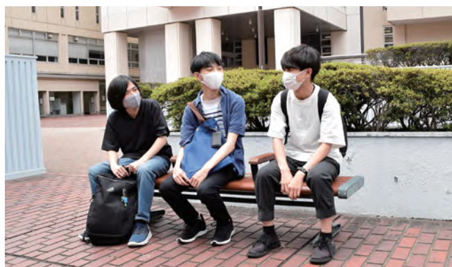
↑ベンチもあり、学生の交流スペースとなっています。