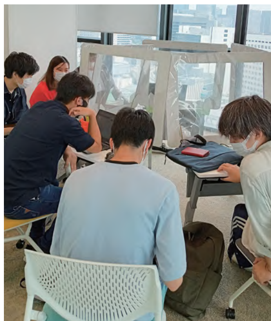
↑ 各フロアには自習やグループ学習に使えるスペースもあります。