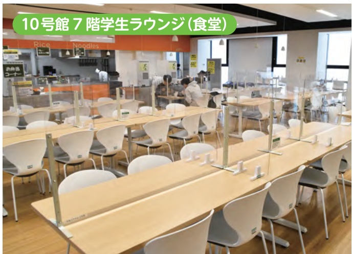
↑ 飛沫防止のパーティションは育友会が寄贈したものです。