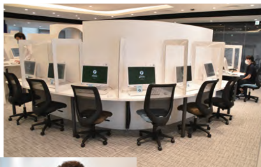
↑ PC 端末が並ぶコーナー。