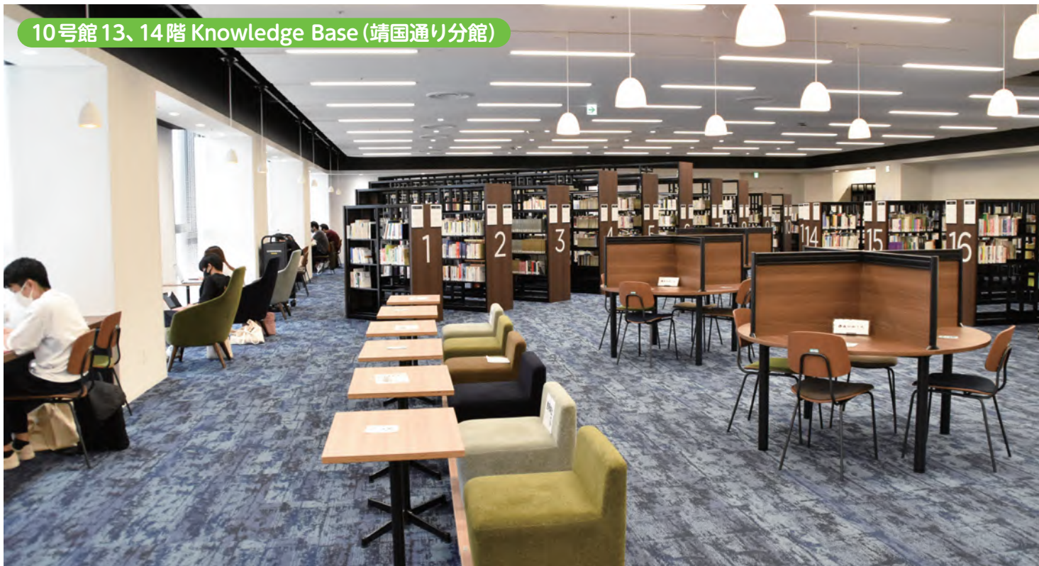
↑ 10号館 13、14階にある図書館です。知識を深める基地となるように「Knowledge Base」と名付けられました。