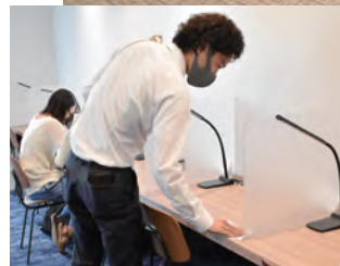
← 館内の机は定期的に巡回し、消毒しています。