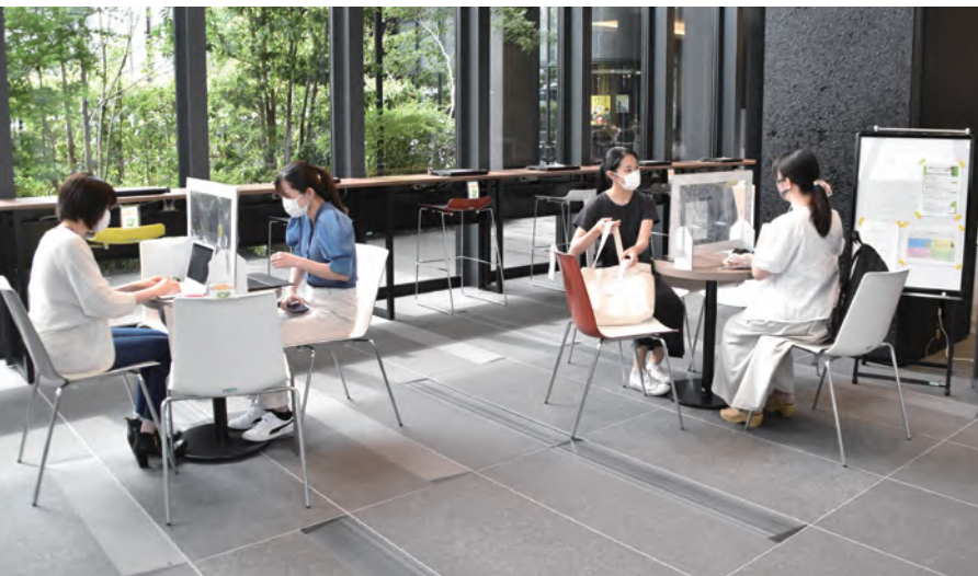
↑ 1階エントランスには、テーブルやPCを利用できるコーナーがあります。