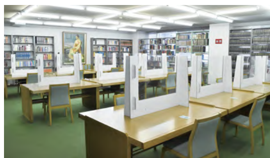
↑育友会寄贈の飛沫防止パーティションを使用し、席を仕切っています。