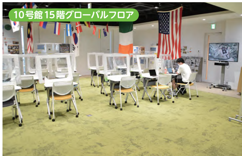
↑ 「国際的に活躍できる人材＝グローバル人材」を育成する情報発信基地です。