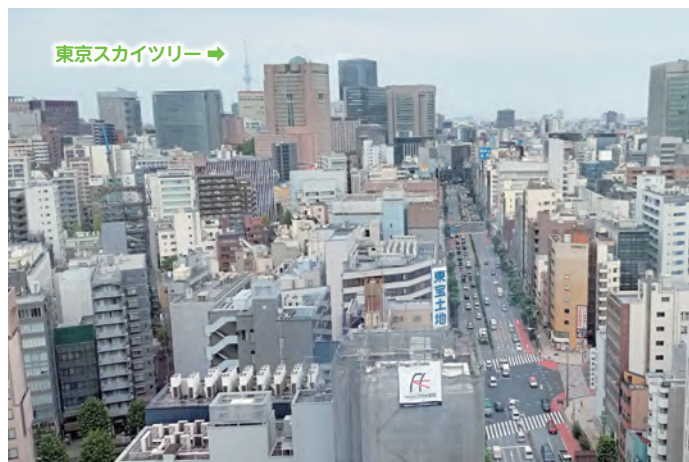
東京スカイツリー →