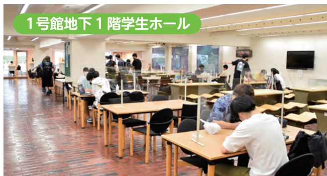
↑自習やグループワークに活用されます。昼休みはこちらでお弁当を食べる学生も多いです。