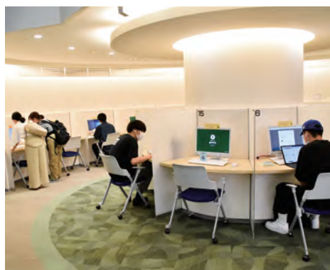
↑AV・PC ラウンジでは、法令・判例、新聞記事などのデータを検索できるほか、DVDの鑑賞などもできます。