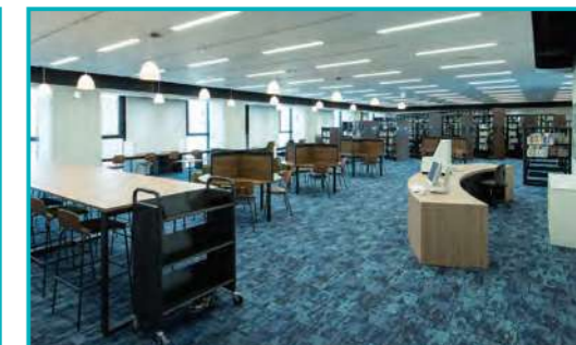
↑13・14階のKnowledge Base (ナレッジ・ベース、図書館靖国通り分館)