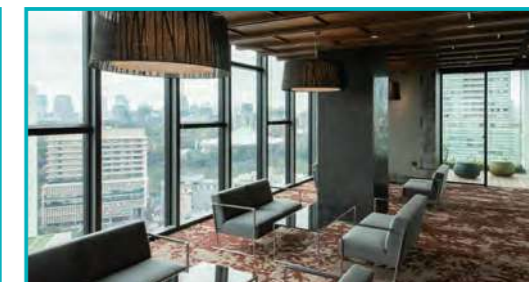
↑16階の鳳サロンからは北の丸公園を一望できます。