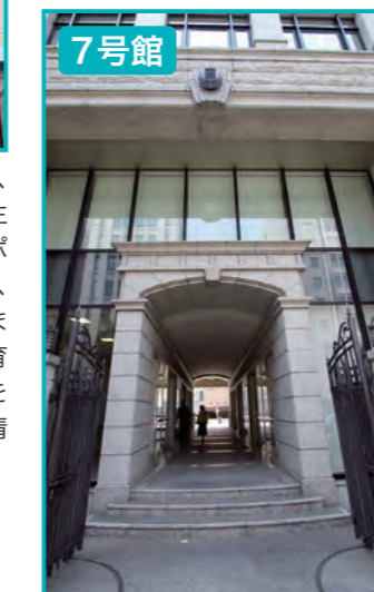
↑2階キャリア形成支援課資料室