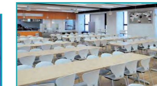
↑7階の学生ラウンジ(食堂)。椅子・テーブル・世界時計は育友会が寄贈したものです。

15階建ての1号館には教室のほか、学生の憩いの場である地下1階の学生ホール、学外者も利用できる「ラ・ポルト・ノアール」(学食)、法廷教室、購買会神田キャンパス店などがあります。校章が輝く3号館には大教室、「育友文庫」「育友文庫ジョイ」や書籍を所蔵する図書館神田分館、教務課、情報科学センターなどがあります。