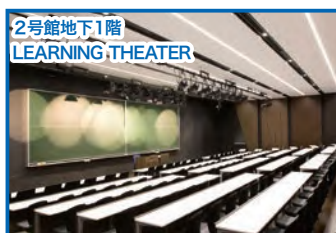
2号館地下1階 LEARNING THEATER

2号館には最新の音響・映像設備を備えた LEARNING THEATER や間仕切りや机を自由にレイアウトできる教室が、3号館には大学院教室や教員の研究室が備わる。