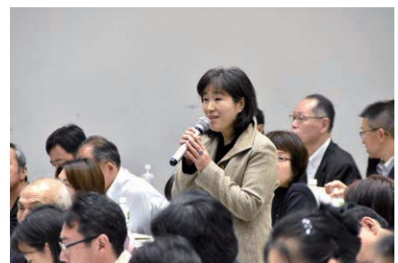
↑支部長から活発な意見が出た

第2回全国支部長会が11月5日（日）に神田キャンパスで開催され、秋田支部、千葉東支部による活動事例の発表、支部懇談会の結果報告、支部運営に関する諸連絡などが行われました。全国から集まった新旧の支部長は活発に意見を交わし、交流を図りました。