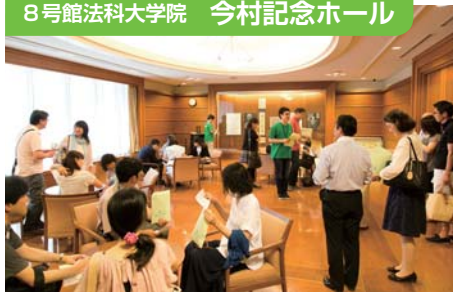
↑ 反骨の弁護士にして第5代総長を務めた 今村力三郎を記念したホール