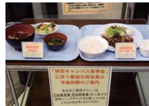
↑ キャンパス見 学会の後は、 学食体験でラ ンチをどうぞ