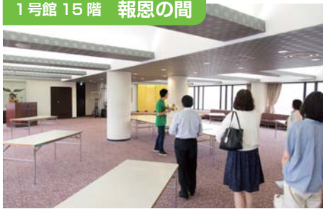
↑見晴らしがよく、間近に日本武道館が見える