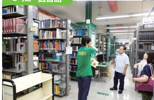
↑地下2階の書庫には法律関係の書籍が充実している