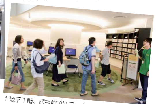
↑地下1階、図書館 AV コーナー