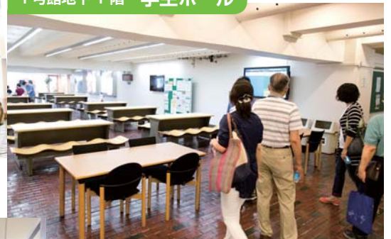
↑普段、学生たちの憩いの場になっている

このキャンパスで学生たちがどのように過ごしているのか、各施設をどう利用しているのか、普段のキャンパスの様子が想像できるような説明を心掛けました。ご父母・保護者の方々の反応はよかったと思います。