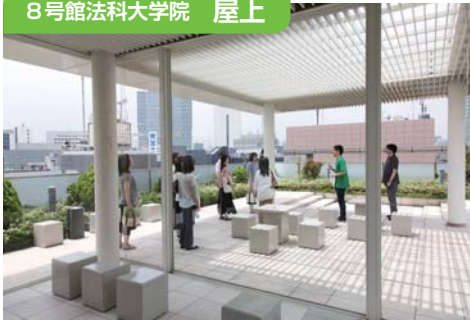
↑ 勉強に疲れたら、ここでリフレッシュする 院生も多い