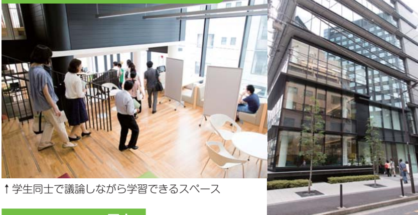
↑ 学生同士で議論しながら学習できるスペース