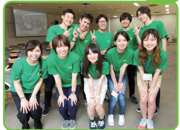
↑案内してくれたのは、オープンキャンパスなどで専修大学を案内している入学センター学生スタッフの皆さん

見学後は、学食体験会を実施。また、午後からは育友会主催ご父母のための就職懇談会が開催され、多くの方が引き続き参加し、有意義な一日を過ごされました。